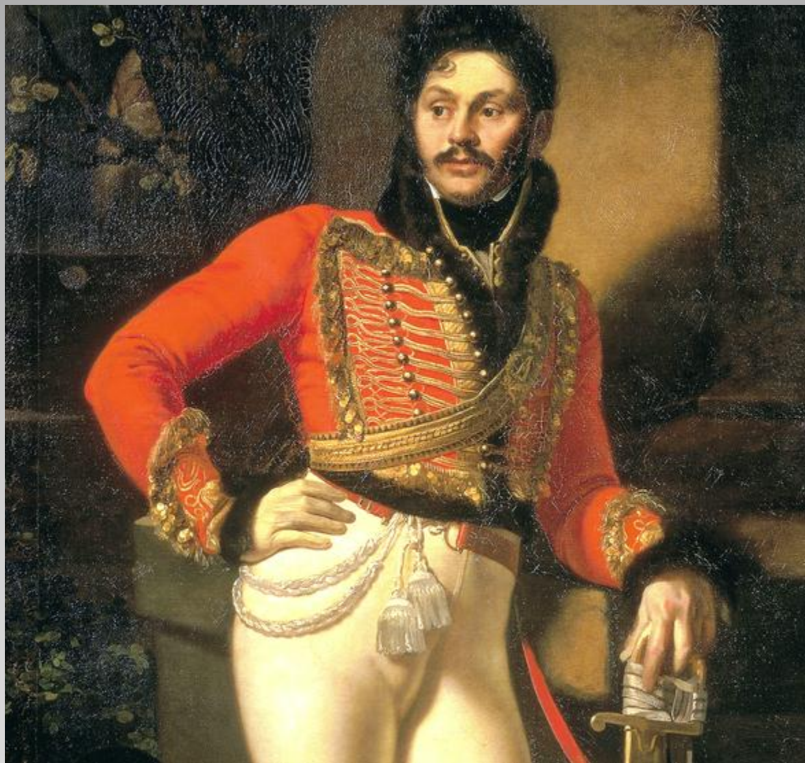
«Гусар Давыдов» (худ. Орест Кипренский)