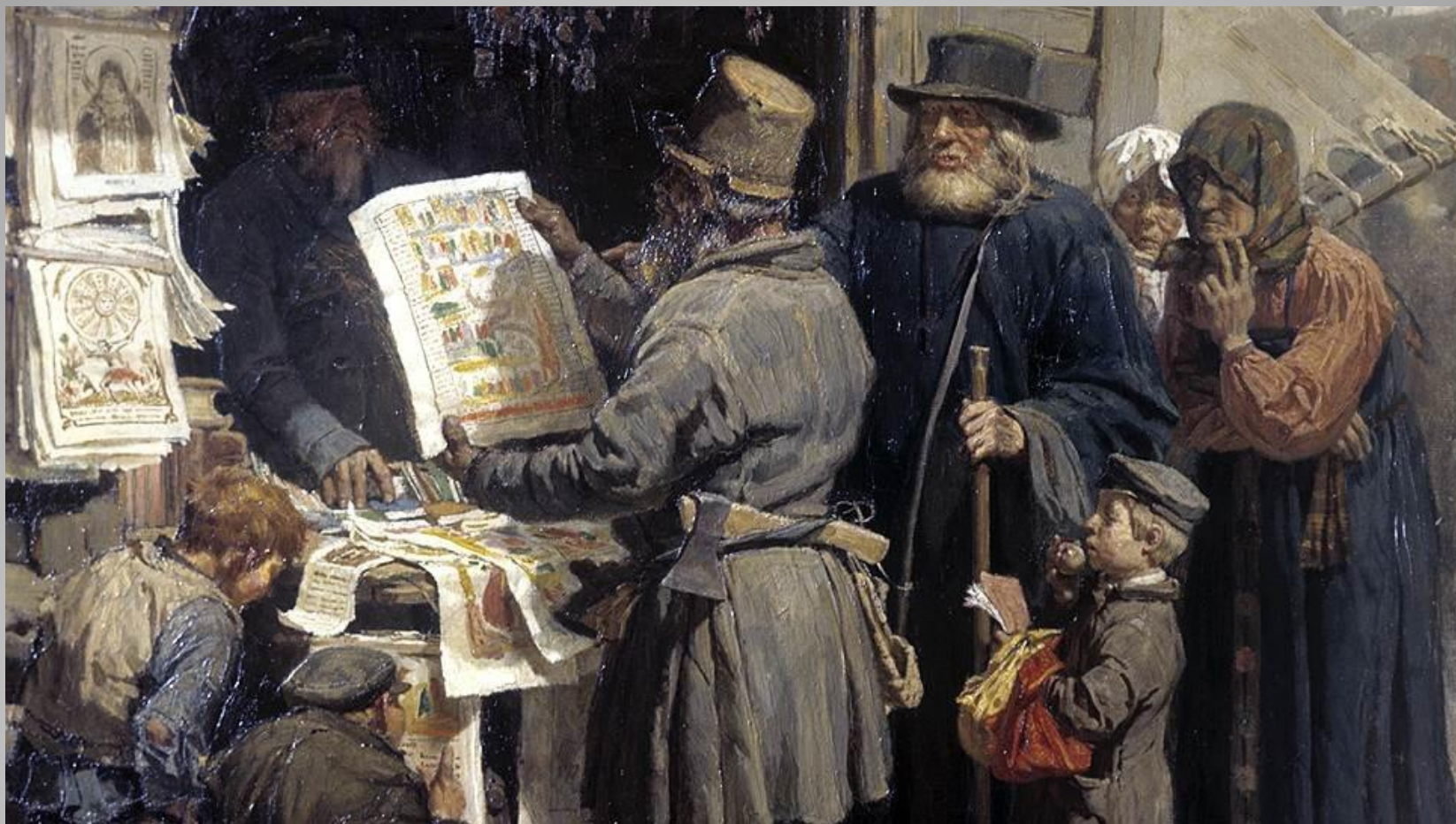
«Книжная лавочка»(худ. Василий Васнецов)