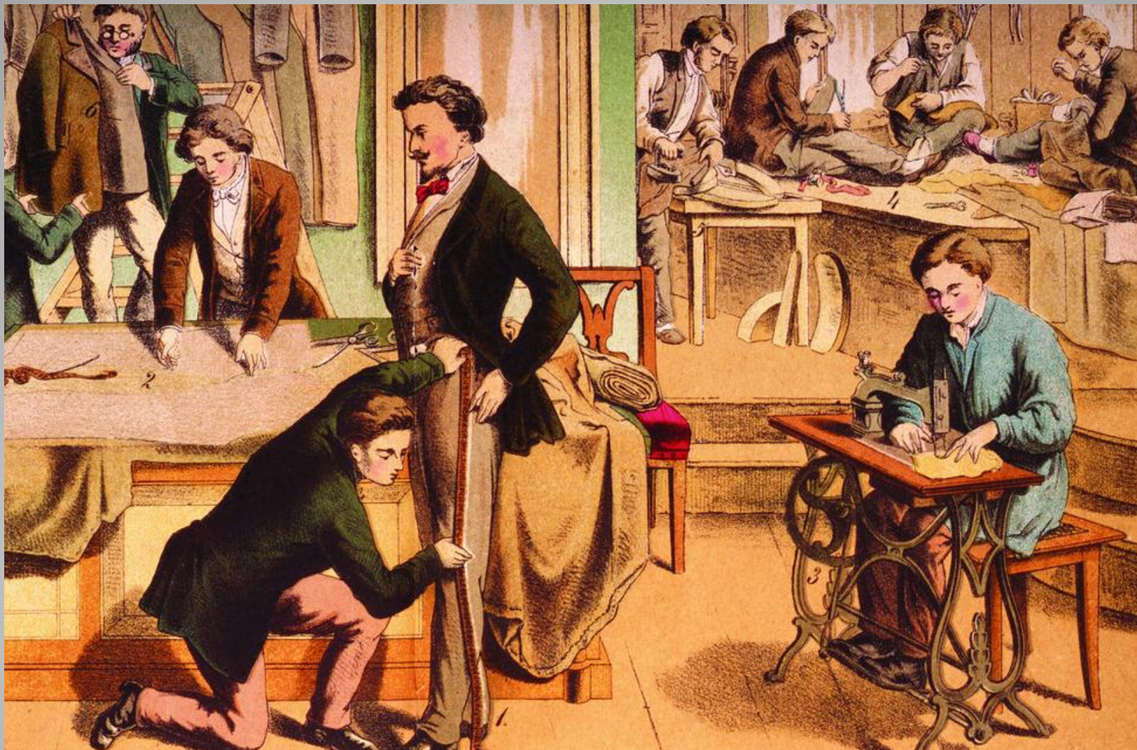
Процесс создания одежды портными.