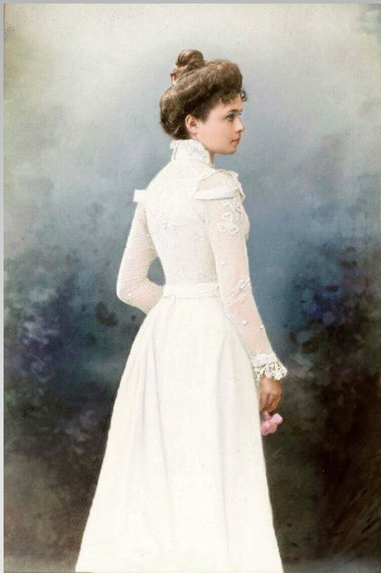
Летнее женское платье для прогулок