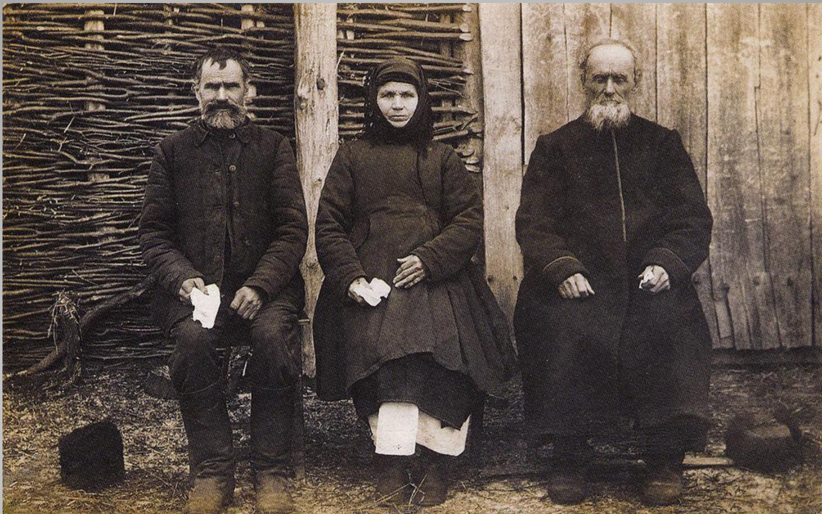
Зажиточные крестьяне IX века.